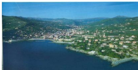
RECCO: CAPITALE GASTRONOMICA DELLA LIGURIA