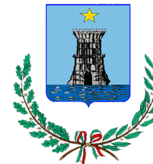
Città di Recco